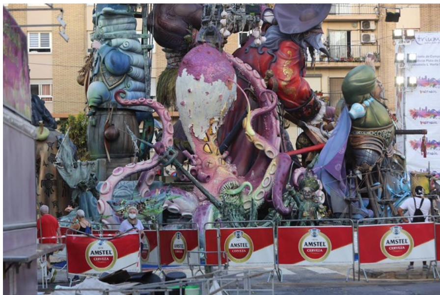
L'Antiga de Campanar va patir danys per les pluges al setembre de 2021