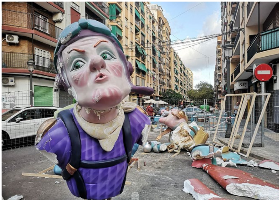
La Falla Calvo Acacio va caure per l'elevat pes del remat central en les Falles del 2021

EL MODELAT , Altre element primordial en el monument faller és el modelat. Modelat que no hem de confondre amb monumentalitat, una falla pot ser molt voluminosa però estar mal modelada. S'entén per modelat, almenys jo ho entenc així, “ la capacitat de construir volumètricament amb perfecció les tres dimensions de les parts d'una falla o figura, mostrant els detalls de la seua textura i volum ”.