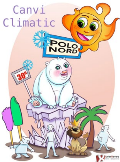
LEMA FALLA GRAN: Canvi Climàtic ARTISTA FALLER: Xavi Herrero