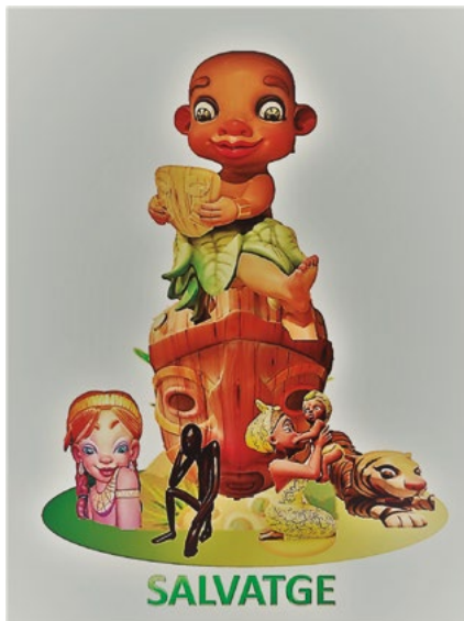
LEMA FALLA GRAN: Salvatge ARTISTA FALLER: Víctor Navarro