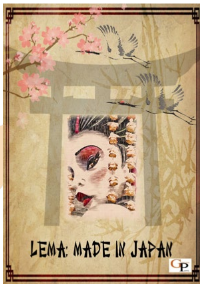
LEMA FALLA GRAN: Made in Japó ARTISTA FALLER: Germans Parra