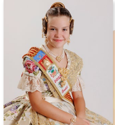
SALUT OROVAL I RUBIO