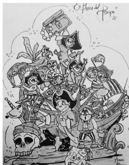
LEMA FALLA INFANTIL: Pirates en busca del tressor ARTISTA FALLER: Estudi d'Art Mauri Vázquez