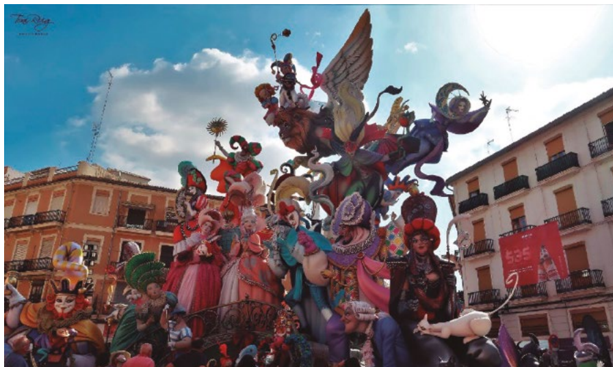
Falla Convent Jerusalem Matemàtico Marzal de Pere Baena - Falla d'acabats exquisits