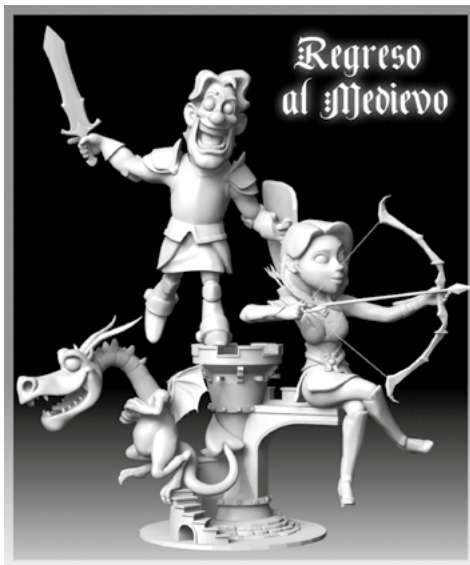
LEMA FALLA GRAN: Retorn a l'Edat Mitjana ARTISTA FALLER: Manu Pons