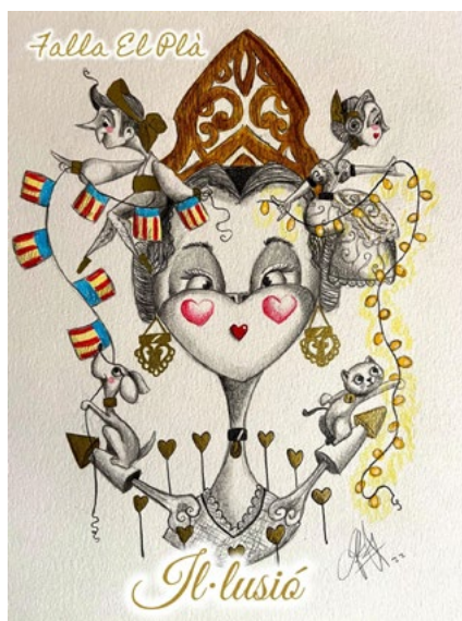
LEMA FALLA INFANTIL: Il·lusió ARTISTA FALLER: David Ojeda