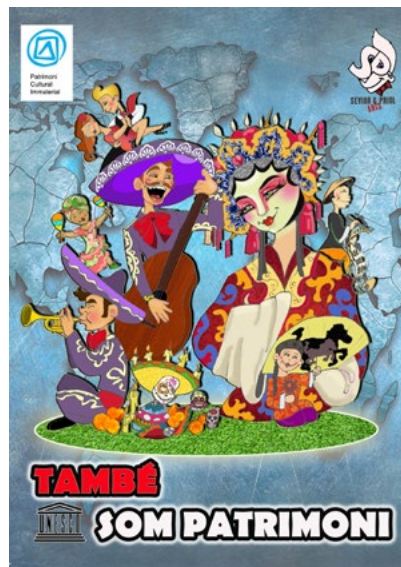
LEMA FALLA INFANTIL: També som Patrimoni ARTISTA FALLER: Sevió i Priol