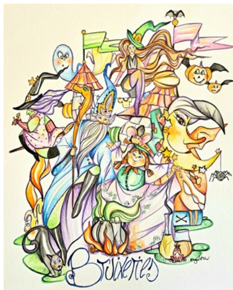
LEMA FALLA INFANTIL: Bruixeries ARTISTA FALLER: Miguel Micó i Sánchez