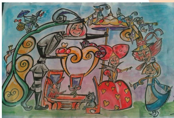
LEMA FALLA INFANTIL: Víctor Pradera en el País de les Meravelles ARTISTA FALLER: Xavi Tur