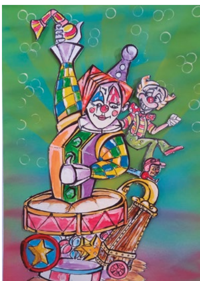
LEMA FALLA GRAN: El món és un circ ARTISTA FALLER: Xavi Tur