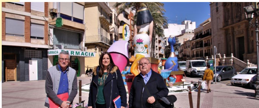
Anys 2019 Jurat de Falles a Lliria