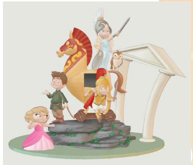
LEMA FALLA INFANTIL: Crema Troia ARTISTA FALLER: La comissió