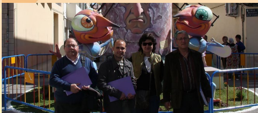
Anys 2008 Jurat de Falles a Massamagrell